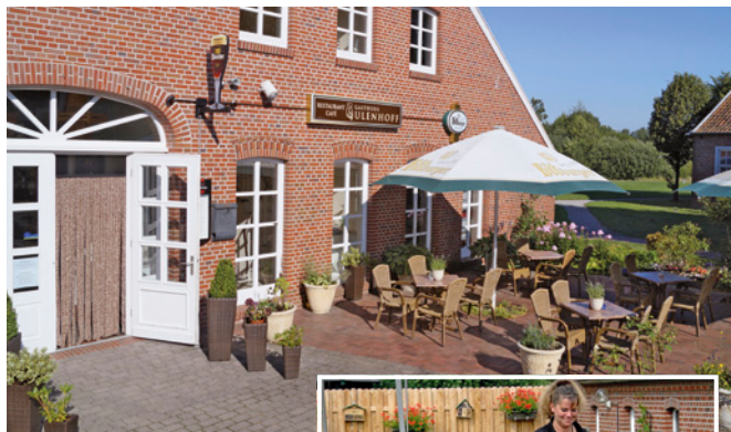
Restaurant Gasthaus Ulenhoff

Tourist-Info Deichstraße 7a Tel. 04955 / 92 00 40 www.ostfriesland-discgolf.jimdo.com